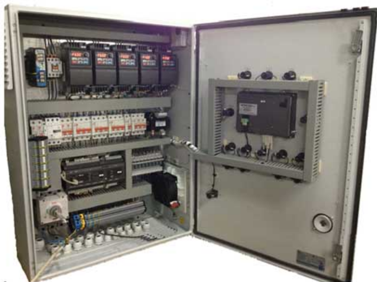
Общий вид шкафа управления