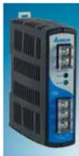
Блок питания DRP024V060W1AZ