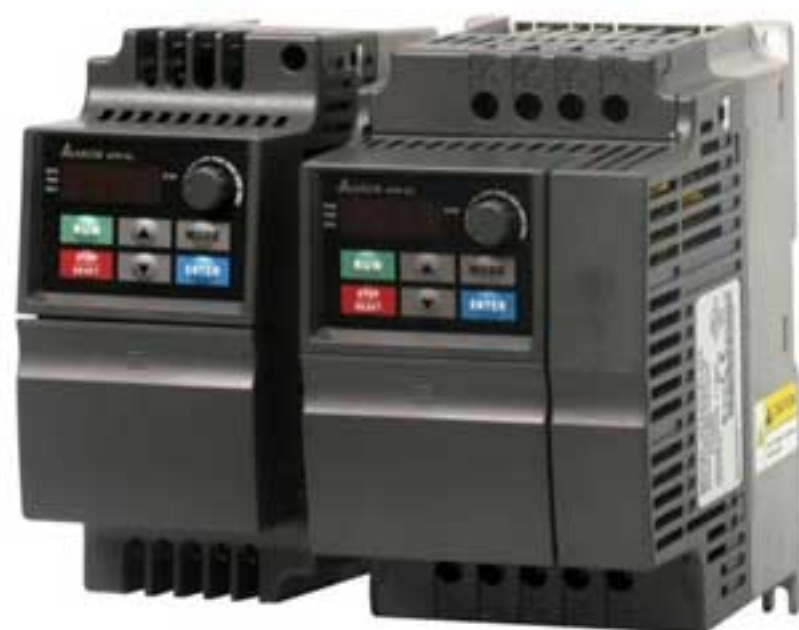
Преобразователь частоты VFD-EL