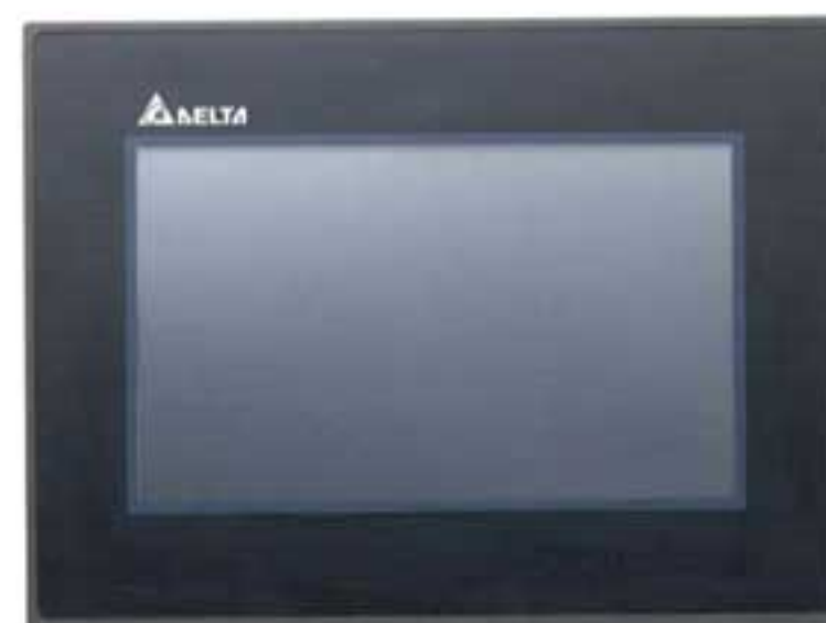
Панель оператора DOP-B